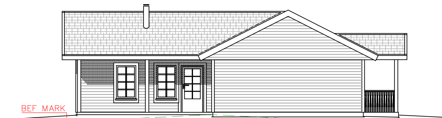
FASAD MOT SYDVÄST