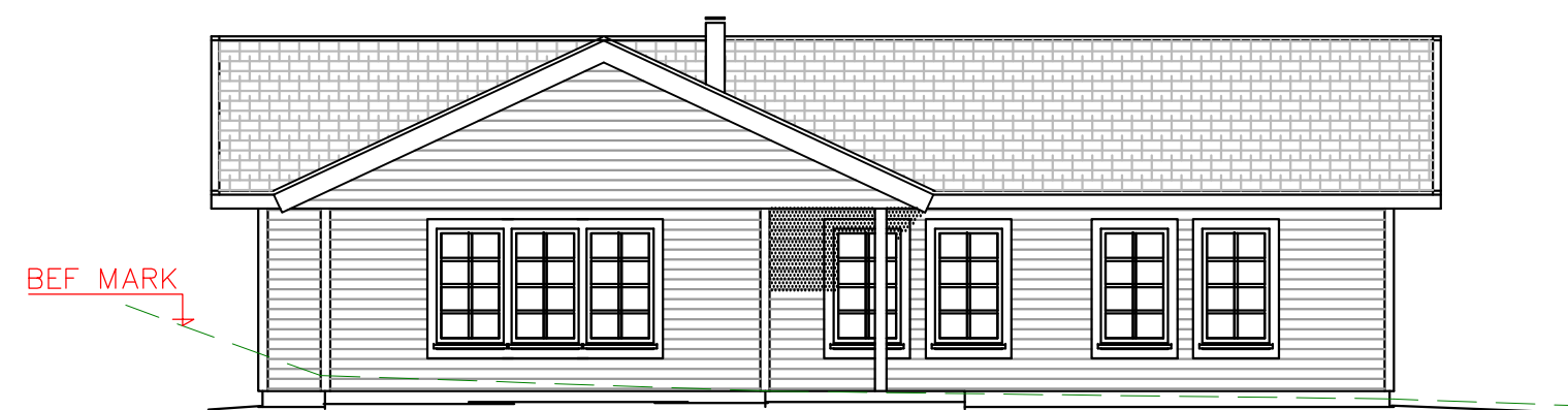
FASAD MOT NORDVÄST