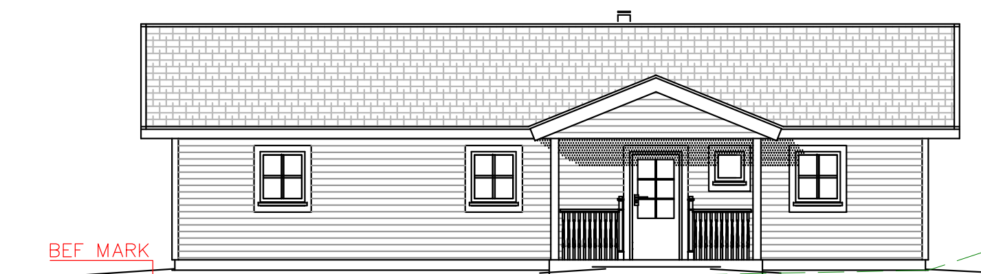
FASAD MOT SYDOST