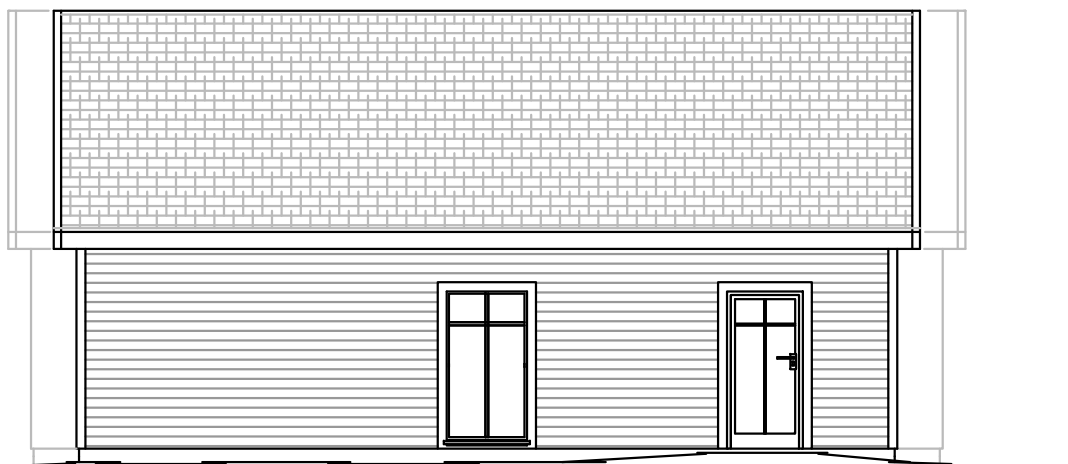
FASAD MOT NODVÄST