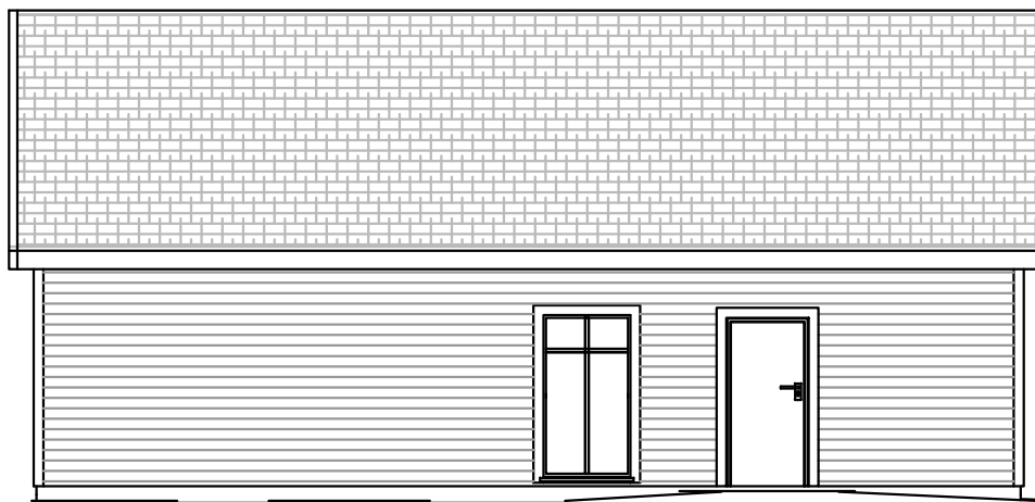
FASAD MOT SYDOST